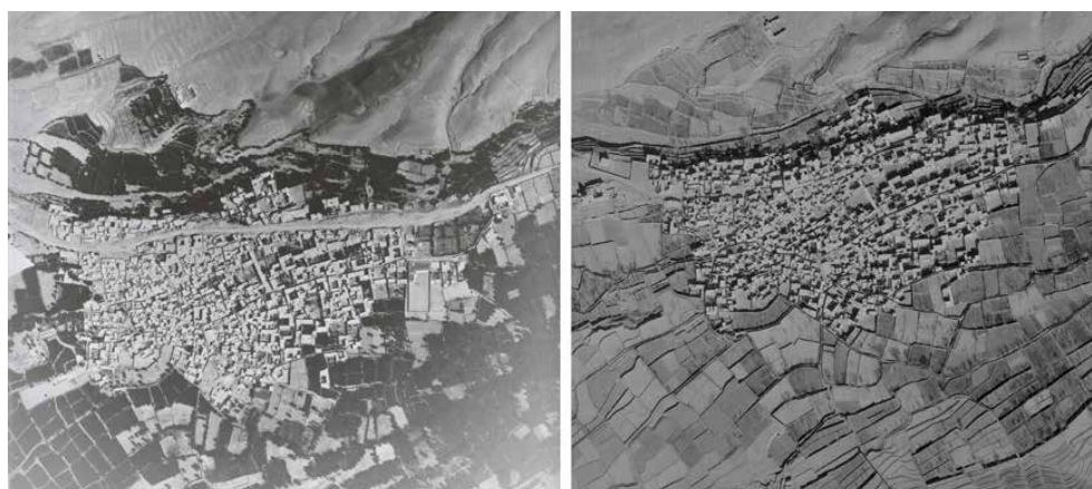
تصویر ۲: نراق در عکس هوایی سال ۱۳۴۵ (راست) و عکس هوایی سال ۱۳۵۴ (چپ)