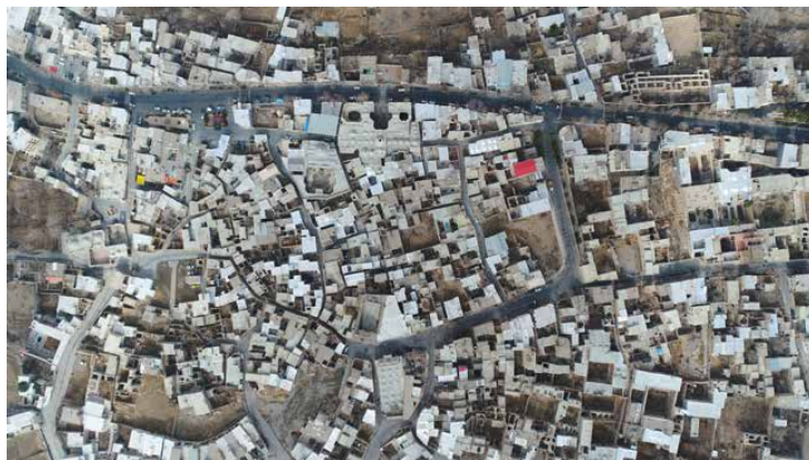
تصویر ۳: بازار تاریخی نراق و ساختار ارتباطی پیرامون آن در سال ۱۳۹۶

تصویر ۳ بر اساس نمایش فضاهای پر و خالی و شکل کلی بناها و معابر، ساخت فضایی الگوی شهری نراق را به خوبی نمایش می‌دهد. هریک از اجزا از جمله گذرها، حیاطها و بناها که تغییر کنند، این الگو تغییر خواهد یافت و آسیب خواهد دید. خصوصیت دیگر این الگو، پیوستگی عناصر پر محدوده به همدیگر و ایجاد یک بافت یکپارچه است. بررسی برخی بخش‌های محدوده تاریخی نشان می‌دهد که این الگو تا چه اندازه در نراق آسیب دیده است. عمده آسیب‌ها ناشی از تخریب و نوسازی واحدها با الگوی پر و خالی دیگری است که نمی‌تواند نظم اولیه را به بافت برگرداند. لذا به نظر می‌رسد اصرار بر الگوی گسترش یافته و بدون مبنای توده‌گذاری یک‌طرفه، بخش مهمی از شخصیت بافت و همچنین پیوستگی آن را از میان می‌برد. هرچند تغییر شکل وسیع گذرها و معابر و همچنین عناصر زیرمجموعه آن‌ها، چون جداره‌های معابر و ساباطها و مسیرهای سرپوشیده نیز الگوی بافت را تهدید می‌کند.