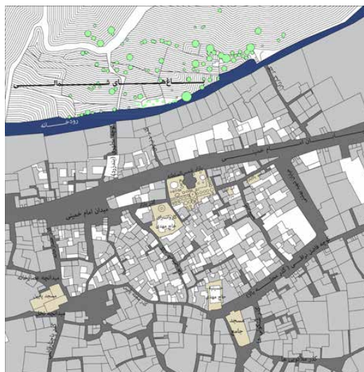
تصویر ۱: بخش تاریخی نراق به همراه معابر، عناصر و فضاهای مهم

باشد؟ هدف مقاله تعریف و تبیین چارچوب و راهبردهای حفاظت از بازار تاریخی نراق است و به واسطه اینکه بازار در ترکیب با محیط شهری پیرامون شکل گرفته است، راهبردهای مورد نظر برای حفاظت، معطوف به بازار و بستر شهری آن خواهند بود.