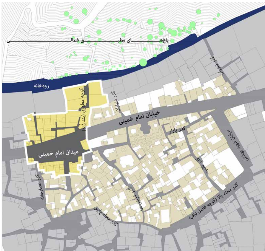
تصویر ۷: ناحیه میدان

در انتهای غربی گذر بازار و در محل تقاطع گذر یادشده و خیابان، فضای بازی وجود دارد که نقش میدان در شهر جدید را بر عهده دارد و با نام میدان امام خمینی شناخته می‌شود. قبل از احداث خیابان، در انتهای گذر بازار و گذر عصارخانه، یک فضای باز وجود داشته است (تصویر ۷). پیرامون این فضای شهری، قبل از احداث خیابان، خانه خان نراق، مهمانخانه او، معبری به سمت باغ‌های شمالی، گذر عصارخانه و همچنین مهم‌ترین محور شهر تاریخی، یعنی گذر بازار وجود داشته است. با عبور خیابان از شمال این فضای باز، شکل این محدوده به یک بخش جانبی در جوار خیابان تقلیل یافته و از نقش آن به‌مثابه میدان قدیمی شهر کاسته شده است. با وجود تمام تغییرات ایجادشده، امکان بازنمایی خطوط قدیمی میدان در جهت افزایش اعتبار فرهنگی آن وجود دارد. در این صورت، میدان قابلیت نقش‌آفرینی به‌عنوان مهم‌ترین فضای شهری نراق را خواهد داشت. این در صورتی است که شهر امروزی متکی بر خیابان، چندان نمی‌تواند بر میدان‌های تاریخی و قدیمی درون محدوده تاریخی محلات بالا و پایین تکیه داشته باشد. به‌واسطه تخریب واحدهای معماری جدار شمالی، شکل میدان تغییر کرده و خطوط قدیمی شکل‌دهنده آن از بین رفته‌اند. از جمله نکات قوت این فضای باز که امروز عنوان میدان شهر را دارد، ارتباط بلافصل با دو گذر اصلی شهر و دسترسی مستقیم به مرکز محله پایین و یکی از مهم‌ترین مراکز اجتماعی نراق یعنی میدانچه نخل است. در ایام مذهبی و حرکت دسته‌های عزاداری و حرکت نخل در شهر، این فضای باز و گذر منتهی به آن از جانب میدان، نقش بسیار مهم خود را به نمایش می‌گذارند. چنین ویژگی‌هایی امکان افزایش نقش پیاده را در صورت بهبود جایگاه میدان فراهم خواهد کرد.