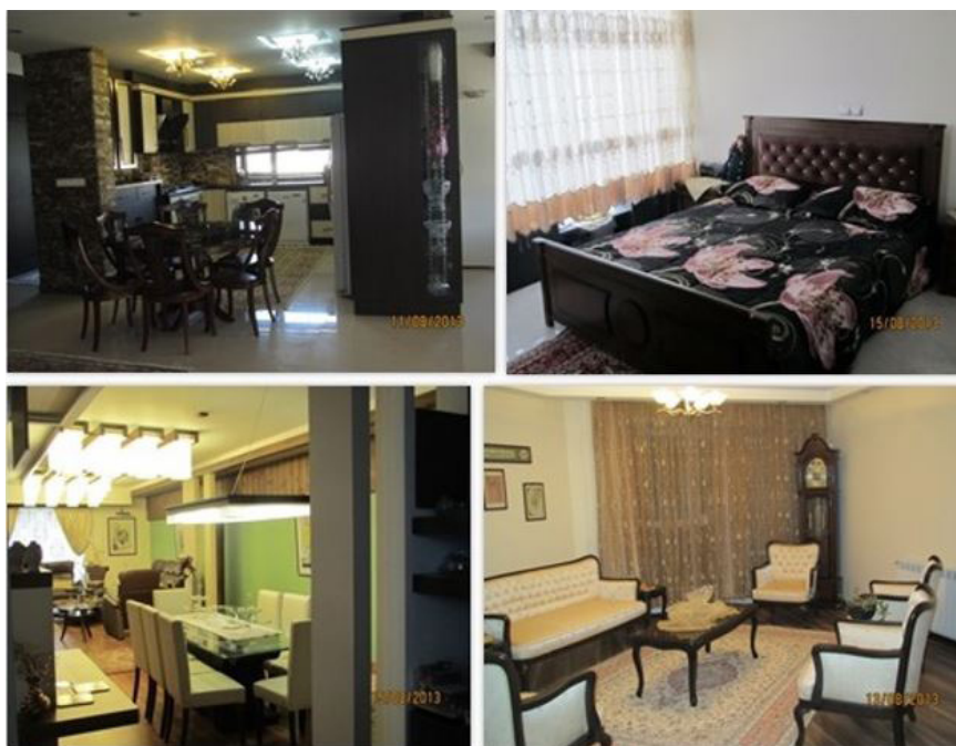
شکل ۲. نمونه‌هایی از وضعیت زندگی در فضاهای داخلی خانه، منطقه استادان

و مقایسه مفاهیم به‌دست‌آمده به تحلیل رابطه فضاهای معماری و فرهنگ مصرفی ساکنین خانه‌ها پرداخته است. جدول ۱ نشان‌دهنده تفاوت خانه‌ها در دو بافت از نظر فضاها، سبک مصرف و تعاریف متفاوتشان از فضاها و رفتارها می‌باشد.