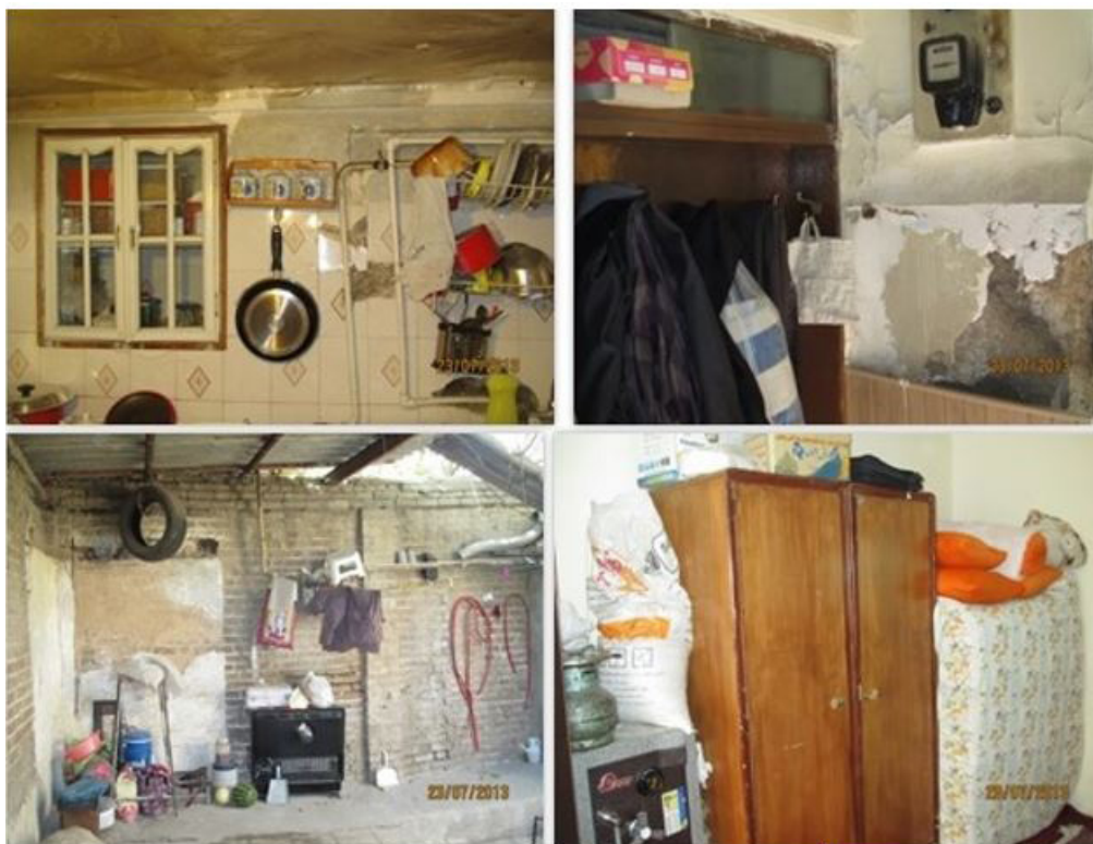
شکل ۱. نمونه‌هایی از وضعیت زندگی در فضای داخلی خانه، منطقه حاجی

که به ترتیب، مناطق حاجی و استادان هستند. در این پژوهش ۱۴ خانه در منطقه حاجی و ۱۳ خانه در منطقه استادان به‌عنوان نمونه در نظر گرفته شده است. البته نمونه اصلی ۱۰ مورد بوده است و به دلیل این‌که در این پژوهش از روش اشیاع نمونه استفاده شده است، چند مورد آخر، به‌عنوان مکمل نمونه محسوب می‌شوند؛ یعنی پژوهش به‌جایی می‌رسد که نمونه جدیدتری جهت مطالعه وجود ندارد و محقق به اشیاع نمونه رسیده است و داده‌ها روبه تکرار می‌روند. جهت تجزیه و تحلیل داده‌ها، داده‌های به‌دست‌آمده به روش توصیفی دسته‌بندی می‌شود و بعد از نشان دادن ابعاد موجود در مفاهیم، ابعاد و مفاهیم را به روش مقایسه‌ای شرح داده است. توصیفات، پایه «نظم دادن‌های مفهومی» حساب می‌شوند. «نظم دادن مفهومی عبارت است از سازمان دادن به داده‌ها در قالب دسته‌ها یا مقوله‌های مشخص (و گاه رتبه‌بندی شده) بر طبق ویژگی‌ها و ابعاد و سپس استفاده از توصیف برای باز کردن و توضیح دادن هر یک از آن دسته‌ها یا مقوله‌ها» (استراوس و کربین، ۱۳۹۰، ۴۰). پژوهشگر با استفاده از این داده‌ها، معنا را استخراج می‌کند. این روش این فرصت را به محقق می‌دهد که تمایزات و تشابهات موجود در گروه‌ها را نیز ببیند و بر اساس آن‌ها تحلیلی عمیق ارائه دهد و از سطح توصیف صرف عبور کند.