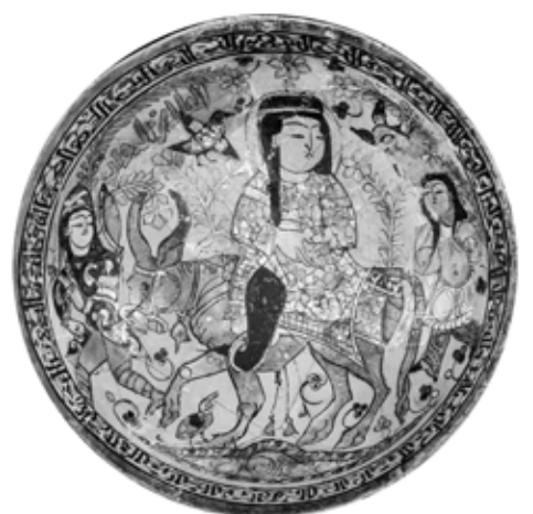
تصویر ۷: کاسه مینایی، احتمالاً کاشان، اواخر قرن ۶ اوایل قرن ۷ هجری، مجموعه کی‌یر (Grube 1976, 200)