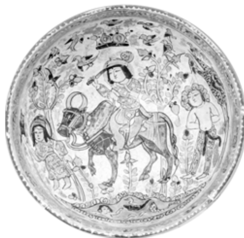
تصویر ۵: کاسه مینایی، احتمالاً کاشان، اواخر قرن ۶ اوایل قرن ۷ هجری، موزه هنری دیترویت (www.dia.org)