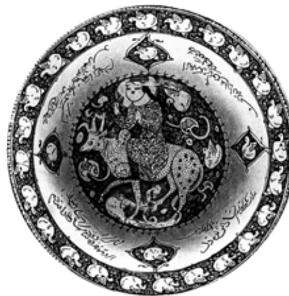
تصویر ۳: کاسه زرین‌فام با تصویر فریدون سوار بر گاو، کاشان، اوایل قرن ۷ هجری، موزه هنرهای صناعی لایپزیگ (Schulz 1914)

نکته‌ای که بد نیست به آن اشاره کنیم، نقوشی است که زمینه تصویر را پر کرده‌اند مانند گیاهان، پرندگان، برکه آب و ماهی‌ها. این آیکن‌ها در آثار سده‌های ششم و هفتم هجری، مواردی نیستند که فقط از جریان روایت پیروی کنند یا جزء خاص یک تصویر باشند. این‌ها عناصر نامرتبلی هستند که از سنت تصویرسازی آن دوران پیروی می‌کنند و معمولاً در همه تصاویر حضور دارند و کمکی به بازشناسی موضوع نمی‌کنند. کتیبه خطوط نیز از این قاعده پیروی می‌کند.