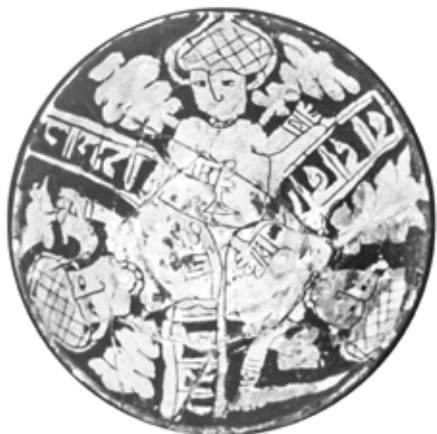
تصویر ۲: کاسه نقش‌کنده با تصویر ضحاک، شیخ تپه ارومیه، قرن ۵ هجری، موزه ملی ایران (کریمی و کیانی ۱۳۶۴، ۱۶۳)