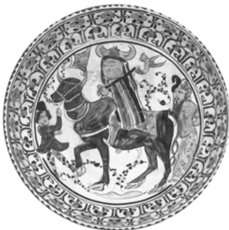
تصویر ۶: کاسه مینایی، احتمالاً کاشان، اواخر قرن ۶ اوایل قرن ۷ هجری، گالری هنر دانشگاه ییل (artgallery.yale.edu)