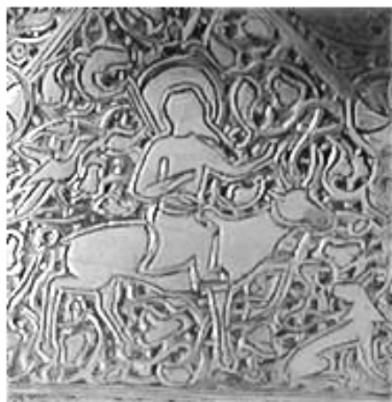
تصویر ۴: بخشی از یک شمعدان برنجی با تصویر فریدون سوار بر گاو، ایران یا عراق، اوایل قرن ۸ هجری، موزه متروپلیتن