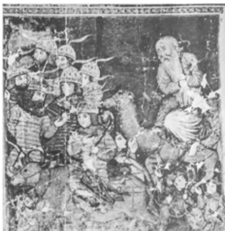
تصویر ۱۱: بخشی از یک نگاره از شاهنامه بزرگ مغولی، ایران، اوایل قرن ۸ هجری، کتابخانه چستربیتی دویلین (Arberry 1959)

اما شاید مهم‌ترین گواه بر تأثیرپذیری بازنمایی‌های مذکور از شاهنامه، ناهماهنگی بین متن و تصویر در نگاره‌های شاهنامه‌های اولیه ایلخانی (اولین نسخه‌های مصور از شاهنامه) مربوط به نیمه اول سده هشتم هجری است. این نگاره‌ها موضوعات مختلفی از روایت فریدون و ضحاک را ارائه می‌دهند: «سپردن فریدون به گاوچران توسط مادرش»، «کوبیدن فریدون گرز را بر سر ضحاک»، «بردن فریدون ضحاک را به کوه دماوند»، «زنجیر کردن فریدون ضحاک را به کوه دماوند» و... و علی‌رغم اینکه در کنار متن قرار گرفته‌اند و طبیعتاً باید از متن پیروی کنند، اغلب در برخی از جزئیات با متن تفاوت دارند. مثلاً در تصویر ۱۱ که نگاره‌ای متعلق به شاهنامه بزرگ مغولی است، فریدون به‌مانند تصاویر آثار سفالی و فلزی، گرز بر دوش و سوار بر گاو نشان داده شده است.