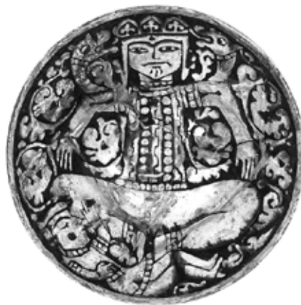
تصویر ۱: کاسه نقش‌کنده با تصویر ضحاک، شیخ تپه ارومیه، قرن ۵ هجری، موزه ملی ایران (کریمی و کیانی ۱۳۶۴، ۱۶۳)