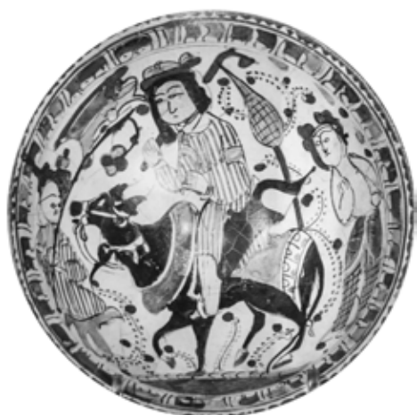
تصویر ۸: کاسه مینایی، احتمالاً کاشان، اواخر قرن ۶ اوایل قرن ۷ هجری، مجموعه هاروی ب. پلوتنیک (Pancaroglu 2007, 112)