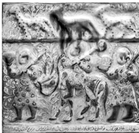
تصویر ۱۰: کاشی زرین‌فام، کاشان، قرن ۷ هجری، مجموعه کورکیان، موزه والترز ( www.thewalters.org )

دلیل دیگر را می‌توان در کاشی مستطیلی موجود در گالری هنری والترز پی جست (تصویر ۱۰). روی این کاشی تصویر فریدون سوار بر گاو و دو شخص ناشناس (م احتمالاً سربازانی که فریدون را در بردن ضحاک به دماوند همراهی می‌کردند) دیده می‌شود. حاشیه پایینی تصویر با یک کتیبه شعر از شاهنامه (ابیات یازدهم و دوازدهم از دیباچه داستان بیژن و منیژه) تزیین شده است. ۱۱ باید گفت علی‌رغم ناهمخوانی متن کتیبه و صحنه تصویرشده، این اشعار، ارتباط و پیوستگی روحی هنرمند با اشعار شاهنامه را نشان می‌دهد.