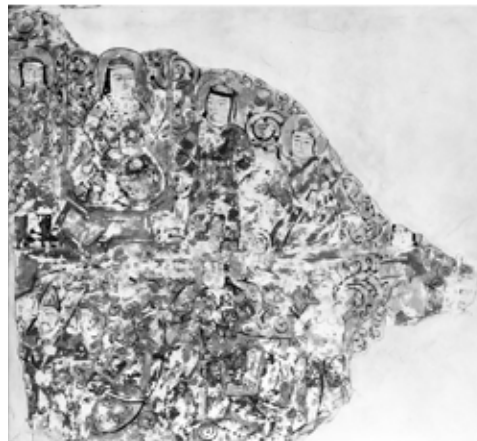
تصویر ۹: قطعه‌ای از دیوارنگاره، ری، قرن ۶ یا ۷ هجری، موزه هنر هاروارد ( www.harvardartmuseum.org )

مصنوعات بسیاری (به‌ویژه قطعات کاشی) از سده هفتم هجری به‌جای مانده که دارای کتیبه‌ای حاوی یک یا چند بیت از اشعار شاهنامه‌اند - همگی با تصاویر نامرتبط - که این حاکی از فراگیر شدن تدریجی اشعار شاهنامه و محبوبیت آن در سطح عمومی بوده است. بنا بر نظر آدامووا قدیمی‌ترین نسخه شناخته‌شده از شاهنامه (نسخه فلورانس با تاریخ ۶۱۴ هجری) - که البته غیرمصور است - درست مربوط به همین دوران است (هیلن براند ۱۳۸۸، ۱۱۳). به هر