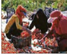
الصورة ٧: نموذج من الشخصية الجماعية

(مركز البحث و التخطيط التعليمي (١)، ١٤٠٢: ٩)