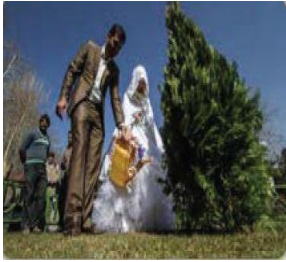
الصورة ٣: نموذج من العملية السردية العابرة

(مركز البحث والتخطيط التعليمي (١)، ١٤٠٢: ٨٩)