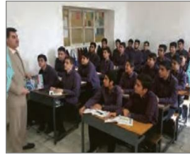
الصورة ١٣: نموذج من البيئة الأصلية للمدرسة

(مركز البحث و التخطيط التعليمي (١)، ١٤٠٢: ٤٢)