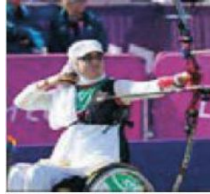
الصورة ٢: نموذج من العملية السردية غير العابرة

(مركز البحث والتخطيط التعليمي (٣)، ١٤٠٢: ٤١)