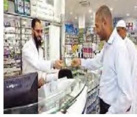
الصورة ١: نموذج من العملية السردية العابرة

(مركز البحث والتخطيط التعليمي (١)، ١٤٠٢: ٨٩)