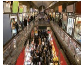
الصورة ١٤: نموذج من البيئة الأصلية للمجتمع

(مركز البحث و التخطيط التعليمي (٣)، ١٤٠٢: ١٣)