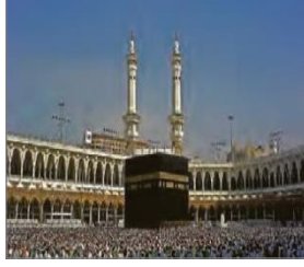
الصورة ١٦: نموذج من البيئة الإقليمية غير الأصلية (مركز البحث و التخطيط التعليمي (١)، ١٤٠٢: ٥٣)