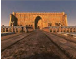
الصورة ١٨: نموذج من البيئة الإقليمية غير الأصلية (مركز البحث و التخطيط التعليمي (٣)، ١٤٠٢: ٣١)