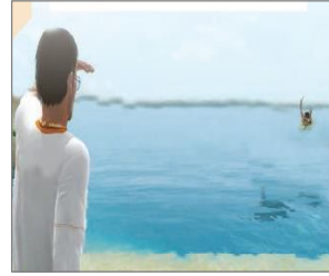
الصورة ١١: نموذج من الشخصيات الكارتونية

(مركز البحث و التخطيط التعليمي (٣)، ١٤٠٢: ٤٠)