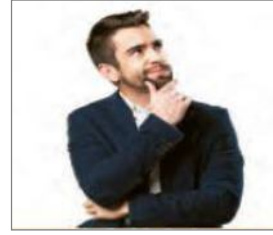
الصورة ٨: نموذج من الصورة الفردية

(مركز البحث و التخطيط التعليمي (٣)، ١٤٠٢: ٢٦)