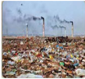
الصورة ٦: نموذج من العملية المفاهيمية

(مركز البحث والتخطيط التعليمي (١)، ١٤٠٢: ٨٢)