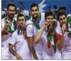
الصورة ٩: نموذج من الشخصية الجماعية

(مركز البحث و التخطيط التعليمي (١)، ١٤٠٢: ٩)