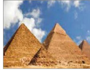
الصورة ١٧: نموذج من البيئة الإقليمية غير الأصلية (مركز البحث و التخطيط التعليمي (٢)، ١٤٠٢: ٥٦)

إنّ نوعاً آخر من البيئة المدروسة هو البيئة غير الأصلية، والتي تقسم إلى قسمين: البيئة الإقليمية والبيئة العالمية. قلما استخدمت الصور ذات البيئات غير الأصلية مقارنة بالبيئات الأصلية، ومن بينها، تم تصوير البيئات غير الأصلية من النوع الإقليمي فقط. على سبيل المثال، في الصورة ١٦ تم إظهار البيئة غير الأصلية لبيت الله الحرام (الكعبة) في مكة المكرمة. تصور الصورة ١٧ البيئة غير الأصلية للأهرامات الثلاثة في مصر، والصورة ١٨ تتعلق بالبيئة غير الأصلية في تيسفون الواقعة غرب بغداد في العراق. ولذلك تعتبر هذه الدول حسب موقعها بيئة غير أصلية من النوع الإقليمي (القارة الآسيوية). لم تستخدم الصور غير الأصلية من النوع العالمي في أي صورة من صور كتب الصفوف الثلاث.