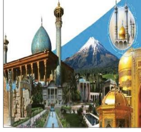
الصورة ٤: نموذج من العملية المفاهيمية التصنيفية

(مركز البحث والتخطيط التعليمي (١)، ١٤٠٢: ٨٢)