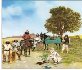
الصورة ١٢: نموذج من الشخصيات الكارتونية

(مركز البحث و التخطيط التعليمي (١)، ١٤٠٢: ٤٩)