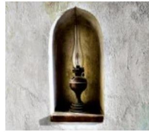
الصورة ٥: نموذج من العملية المفاهيمية الرمزية الصورة

(مركز البحث والتخطيط التعليمي (٣)، ١٤٠٢: ٥٥)