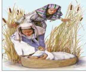
الصورة ١٠: نموذج من الشخصيات الكارتونية

(مركز البحث و التخطيط التعليمي (١)، ١٤٠٢: ٤٩)