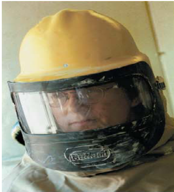
شکل ۶ تصویر کلاه‌های که ناحیه سر و گردن را می پوشاند

ث تعمیر، بازرسی، تمیز کردن و نگهداری وسیله حفاظت تنفسی.