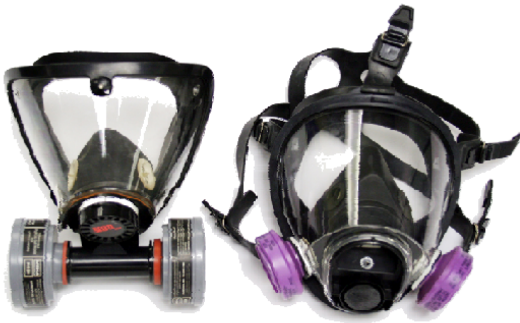
شکل ۴ تصویر ماسک های پوشاننده تمام صورت