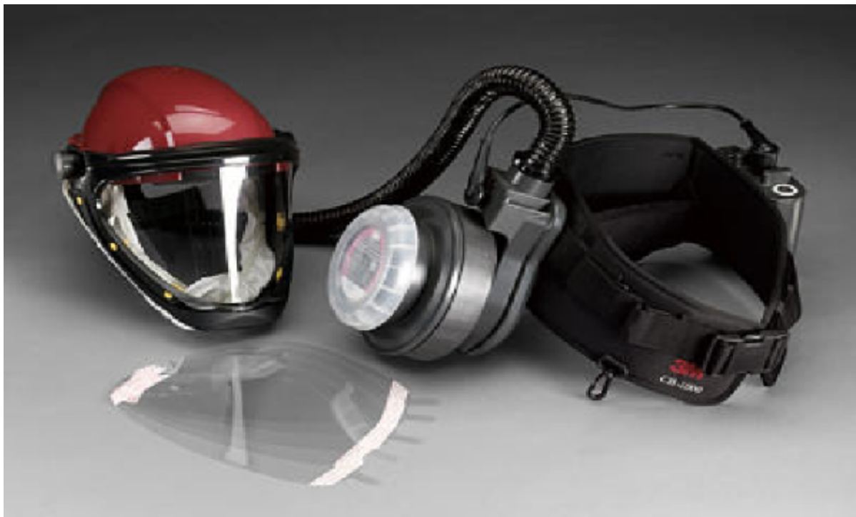
شکل ۵ تصویر وسیله تصفیه هوا (PAPR)

۳ ۴ ۸ در صورت وجود غلظت بیش از اندازه نانوذرات در محیط کار (پس از اجرای کلیه کنترل‌های مهندسی، مدیریتی و روش‌های اجرای کار) از وسایل حفاظت تنفسی فشار مثبت ۱ (مانند وسیله تصفیه هوا) استفاده نمائید. وسیله تصفیه هوا (PAPR)، وسیله حفاظت تنفسی است که از یک دمنده برای عبور هوای اتمسفر از درون یک تصفیه کننده هوا (مثل فیلتر یا کارتریج) استفاده می‌کند. هوای تمیز و سالم پس از جذب آلودگی توسط قطعه تصفیه کننده وارد محفظه تنفسی ماسک می‌شود (شکل ۵). وسایل حفاظت تنفسی مختلف درجات حفاظت مختلفی را تأمین می‌کنند. استفاده از وسایل حفاظت تنفسی فشار منفی و ماسک‌های جراحی به هیچوجه توصیه نمی‌شوند. وسایل حفاظت تنفسی زیر می‌توانند براساس سطح مورد نظر کاهش مواجهه و مزایا و معایب هر کدام از آنها مورد استفاده قرارگیرند. استفاده از فیلترهای نوع P-۱۰۰ مورد تأکید بیشتر است.