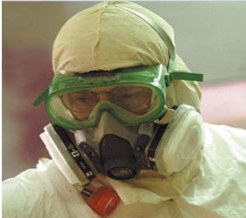
شکل ۴ تصویر گاگل ایمنی و ماسک پوشاننده نیمه صورت